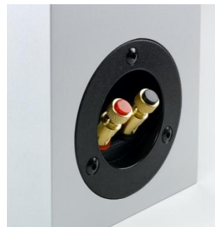
Shelf G70 Klemmen