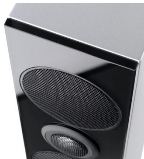
Shelf G70 Glasfront