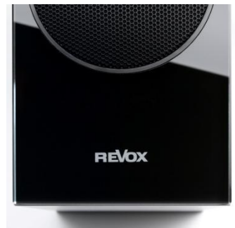
Shelf G70 Logo