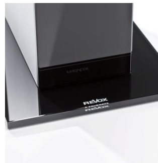
Logo auf schwarzem Glasfuß