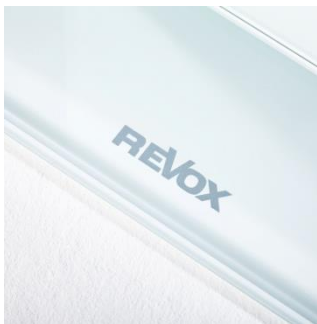
Logo auf weißem Glasfuß

Vier langhubige Bass-Treiber, ein verzerrungsarmer Mitteltonlautsprecher und ein Hochtöner mit großer Gewebemembrane sorgen für das ungemein exakte und kraftvolle Klangbild der Prestige G140. Die elegante Klangsäule liefert als Stereolautsprecher ebenso wie in Surround-Konfigurationen exzellente Klangergebnisse.