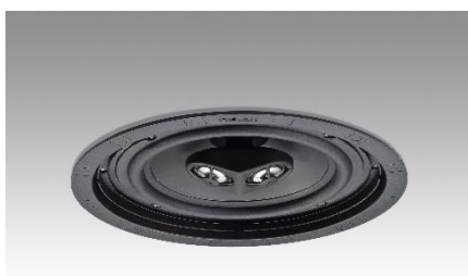
Revox Inceiling I82 stereo ohne Abdeckung

Trotz seiner denkbar geringen Abmessungen, leistet der Revox Inceiling I82 stereo klanglich Erstaunliches. Die Tief-mitteltöner sorgen für ein kraftvolles und klares Klangvolumen im tiefen Frequenzbereich. Somit erübrigt sich in den meisten Fällen die Aufstellung eines zusätzlichen Basslautsprechers. Ergebnis ist ein brillanter, raumfüllender Klang, ohne dass sich sichtbare Technik in den Vordergrund drängt. Und mit dem Inceiling I82 stereo Lautsprecher ist bei knappen Raumverhältnissen auch eine hochwertige Stereobeschallung mit nur einem Lautsprecher möglich.