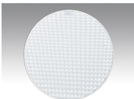
Revox Inceiling I82 stereo