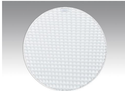
Revox Inceiling I82