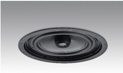
Revox Inceiling I82 ohne Abdeckung