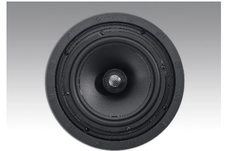
Revox Inceiling I82 ohne Abdeckung